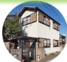
シルバーハウス寿楽