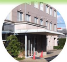
楠目循環器科内科・眼科