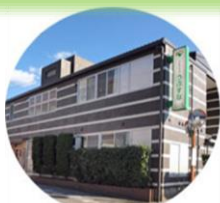
フルハウスうぶすな