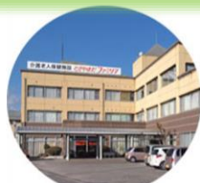
とさやまだファミリア