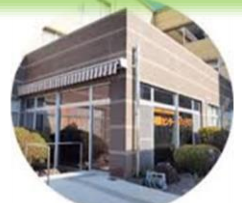
相談センターファミリア